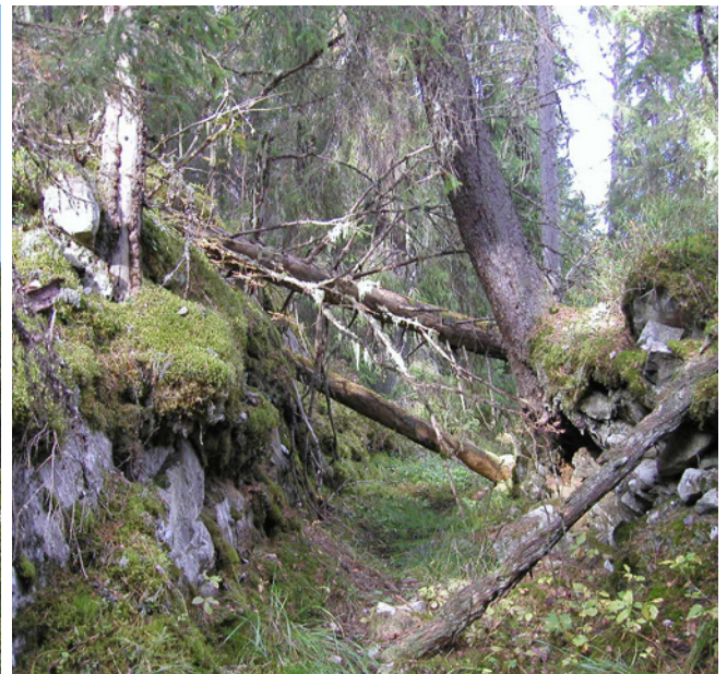
(T.v) Branten upp mot Limberget. Svårigheten att ta sig dit med skogsmaskiner har gjort att skogen fått stå kvar.