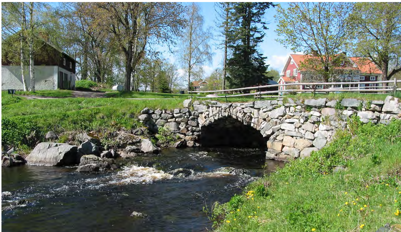
Grängshytteforsarna ligger i gammal bergsmansbygd.