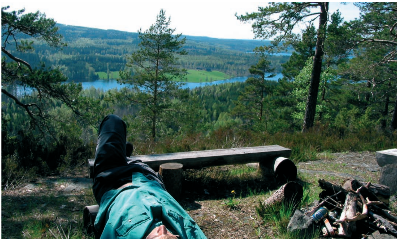
En tupplur på toppen av en av Erikabergets höjder med Rastälvens dalgång nedanför fötterna.

Erikaberget är ett välkänt utflyktsmål sedan många år tillbaka. Från toppen av Erikaberget, 210 meter över havet, bjuds besökaren en vacker utsikt över Rastälvsdalen, en av Bergslagens dalgångar som löper i nord-sydlig riktning. Förr vallfärdade gästerna på den gamla kurorten i Nyhyttan upp till toppen för att njuta av den friska luften och solnedgången.