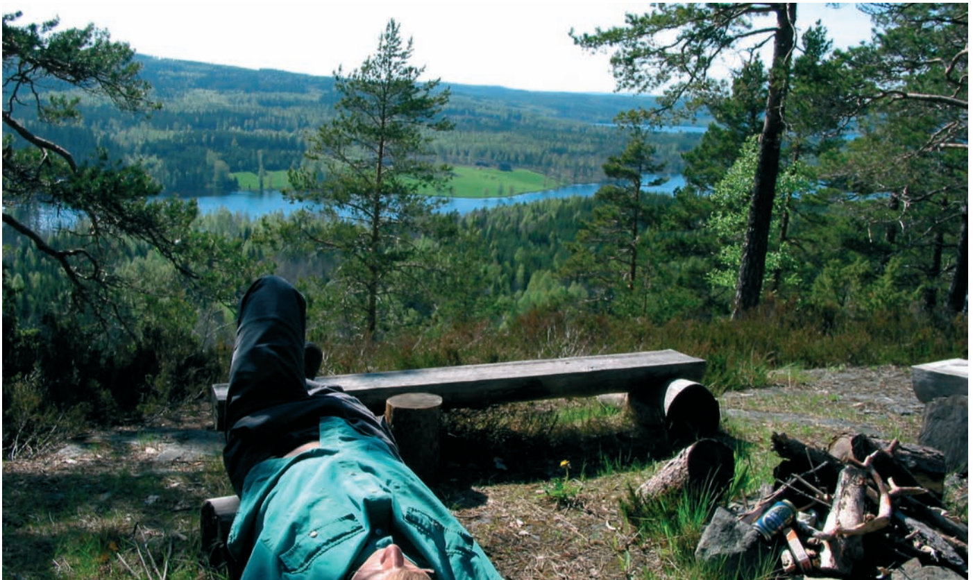
En tupplur på toppen av en av Erikabergets höjder med Rastälvens dalgång nedanför fötterna.

Erikaberget är ett välkänt utflyktsmål sedan många år tillbaka. Från toppen av Erikaberget, 210 meter över havet, bjuds besökaren en vacker utsikt över Rastälvsdalen, en av Bergslagens dalgångar som löper i nord-sydlig riktning. Förr vallfärdade gästerna på den gamla kurorten i Nyhyttan upp till toppen för att njuta av den friska luften och solnedgången.